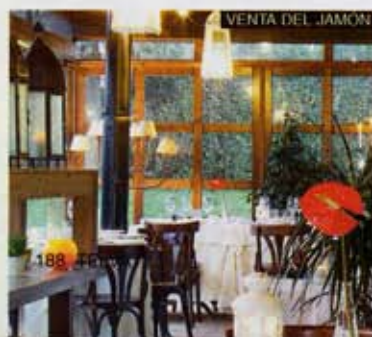
VENTA DEL JAMÓN