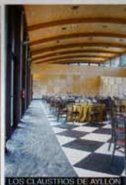
LOS CLAUSTROS DE AYLLÓN