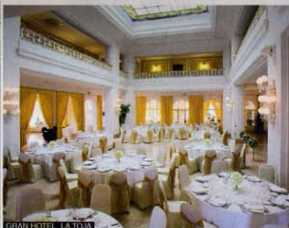
GRAN HOTEL LA TOJA